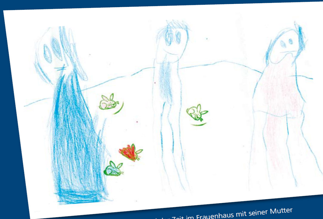
Kind 5 J. (rechts), gezeichnet während der Zeit im Frauenhaus mit seiner Mutter

Kinder als Betroffene von Gewalt zwischen ihren Eltern